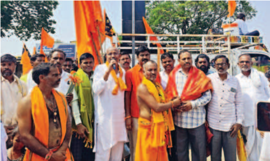
मदनूर, 24 मार्च (स्वतंत्र वार्ता)।

मंडल केमराज कल्लाई से लेकर मदनूर मंडल सलबतपुर हनुमान मंदिर के दर्शन के लिए भक्तों द्वारा पदयात्रा निकाली गई। इस यात्रा में हजारों महिला एवं पुरुष भक्त जय हनुमान जय श्री राम के नारे लगाते हुए सम्मिलित हुए।