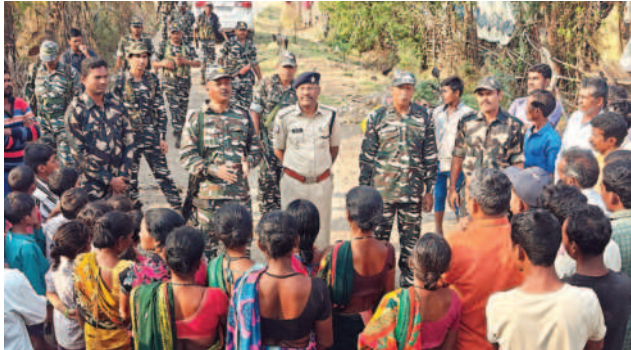
आसिफाबाद, 24 मार्च (स्वतंत्र वार्ता)।