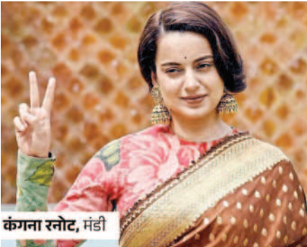
कंगना रनौत, मंडी

मंडी से कंगना रनौत, मेरठ से अरुण गोविल, पुरी से संबित पात्रा को टिकट